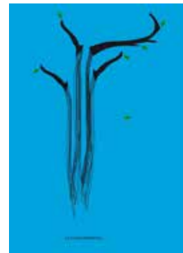
1er dimanches : Lillico - Champs Libres 3 avril