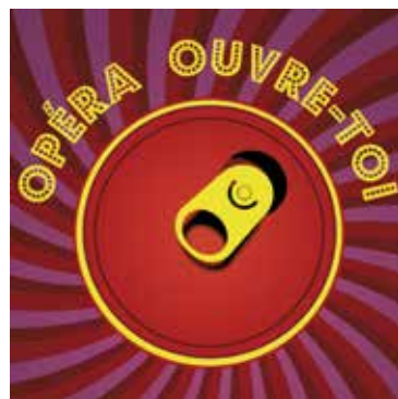
Opéra ouvre-toi 2 & 3 avril