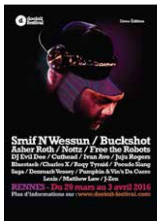
Dooiint festival > 3 avril