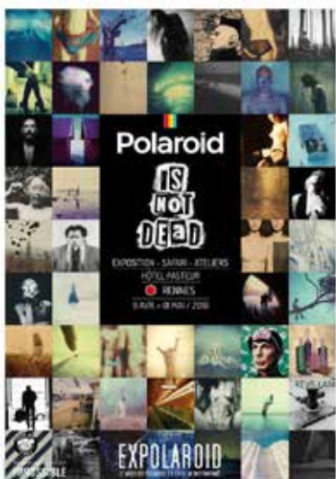
Polaroid is not dead