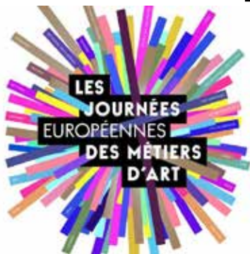
Journées européennes des métiers d'art 1 & 2 avril - 4bis