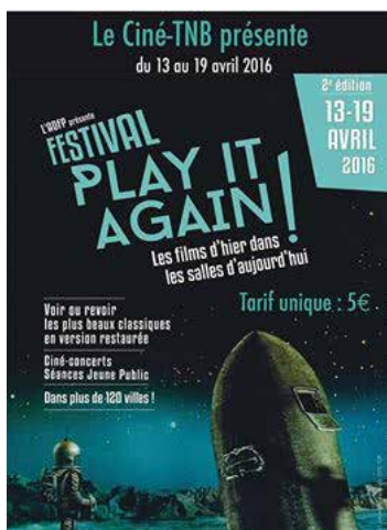
Play it again 13 > 19 avril