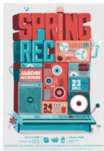
Spring rec 23 avril