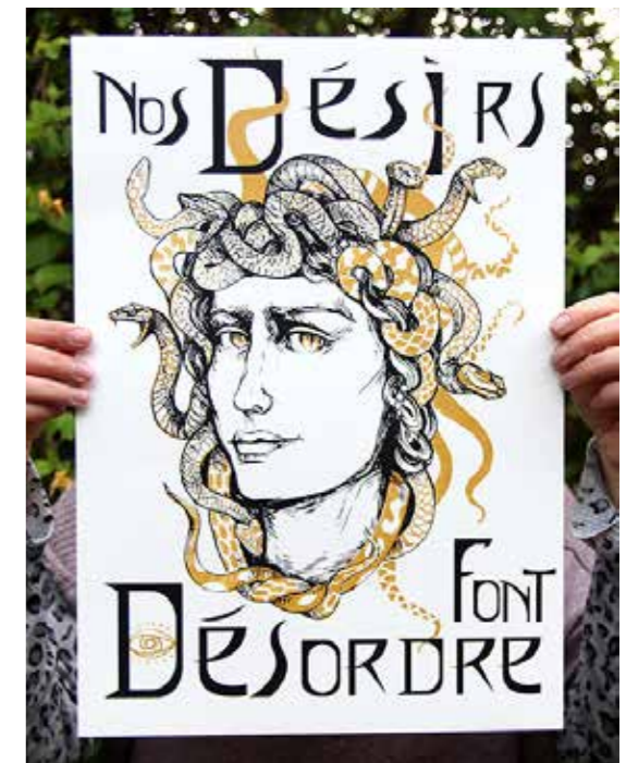
Affiche sérigraphiée 2 couleurs Format A3 - 15€

F comme fièr·e·s (et féministes) se propose d'aborder le sujet avec une approche de vulgarisation, d'exploration et de création artistique. Une galerie de portraits par entrées thématiques (justice, science, écologie, musique...), un portfolio photo, une approche illustrée sur le 'Female gaze', ainsi que des sélections de livres jeunesse, des films ou encore des slogans ! Le tout ponctué de citations et d'appels à la découverte. Un ouvrage collectif pour une approche sensible et documentée sur les féminismes.